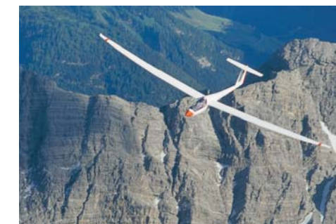
poster In einem Discus über den Allgäuer Alpen