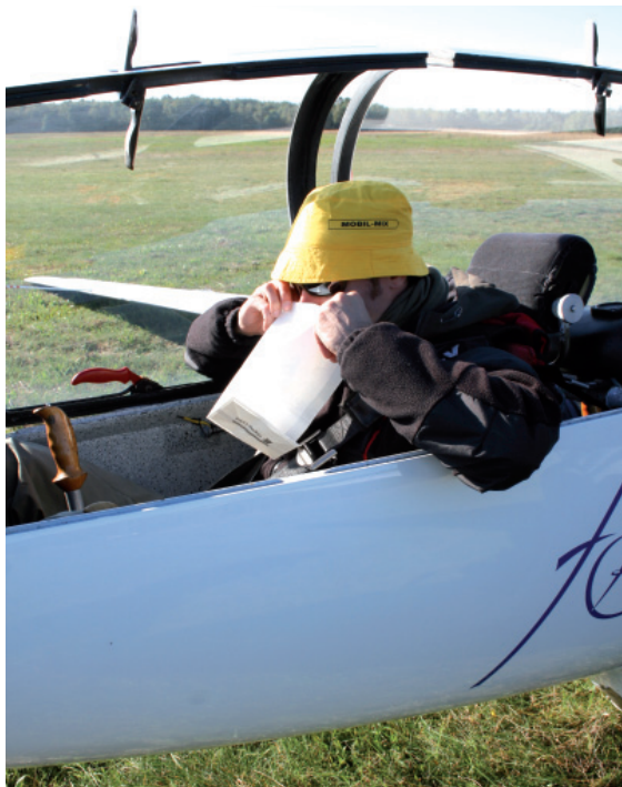
Der Griff zur Tüte ist für Unerfahrene nach dem Kunstflug keine Seltenheit. Aber auch beim „normalen“ Segelflug kann es zur Reisekrankheit kommen